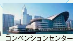
コンベンションセンター